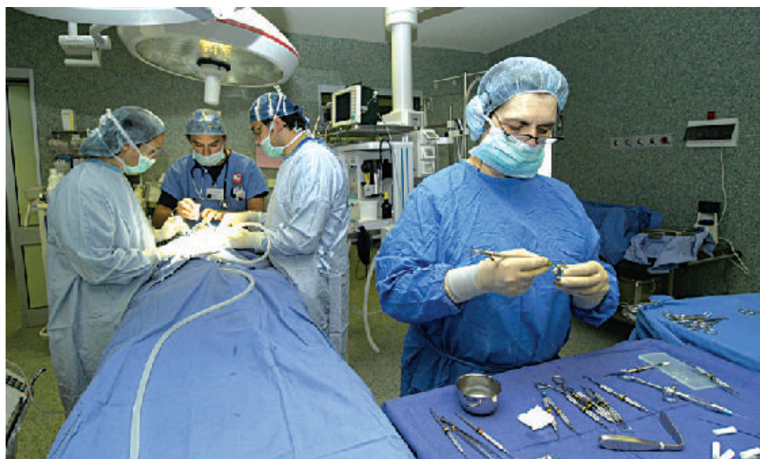
IMPLANTOLOGIA Gli impianti dentali possono assicurare oggi soluzioni simili in tutto a quelle naturali